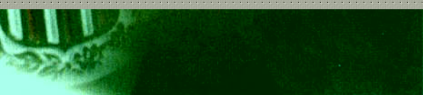
e do Fed, Ben Bernanke, durante entrevista

Fed” (É Realizações), publicado em 2009 nos EUA.