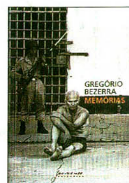
Memórias , de Gregório Bezerra • Editora Boitempo, 648 páginas • R$ 74