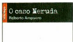
O caso Neruda , de Roberto Ampuero. Tradução de Wladir Dupont • Editora Bem-te-vi, 121 páginas • R$ 44,90

• Entre o relativismo liberal e a condenação conservadora da "decadência" moderna, o filósofo Charles Taylor propõe um modelo em que os valores sejam pensados como construção do "eu" em diálogo com a sociedade.