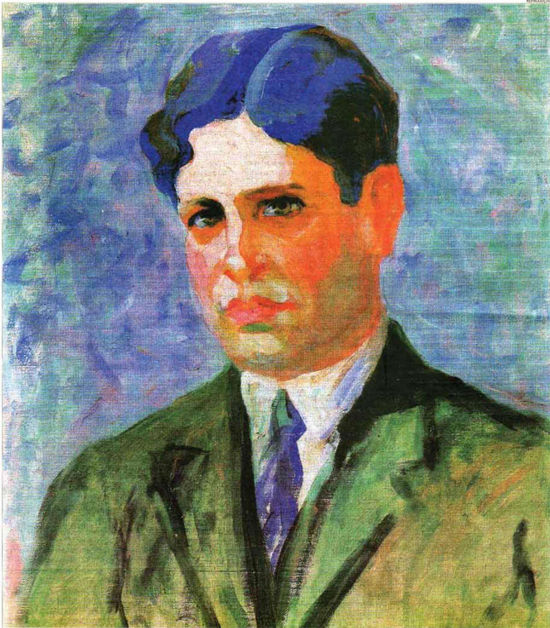
Oswald de Andrade, em retrato pintado por Tarsila do Amaral: sua antropofagia é vista hoje como um conceito, na esfera ideológica, que atualiza a questão da globalização