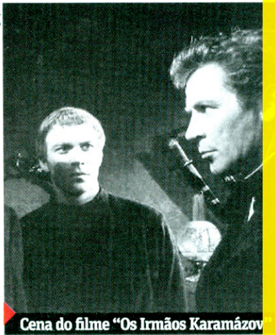
Cena do filme "Os Irmãos Karamázov"