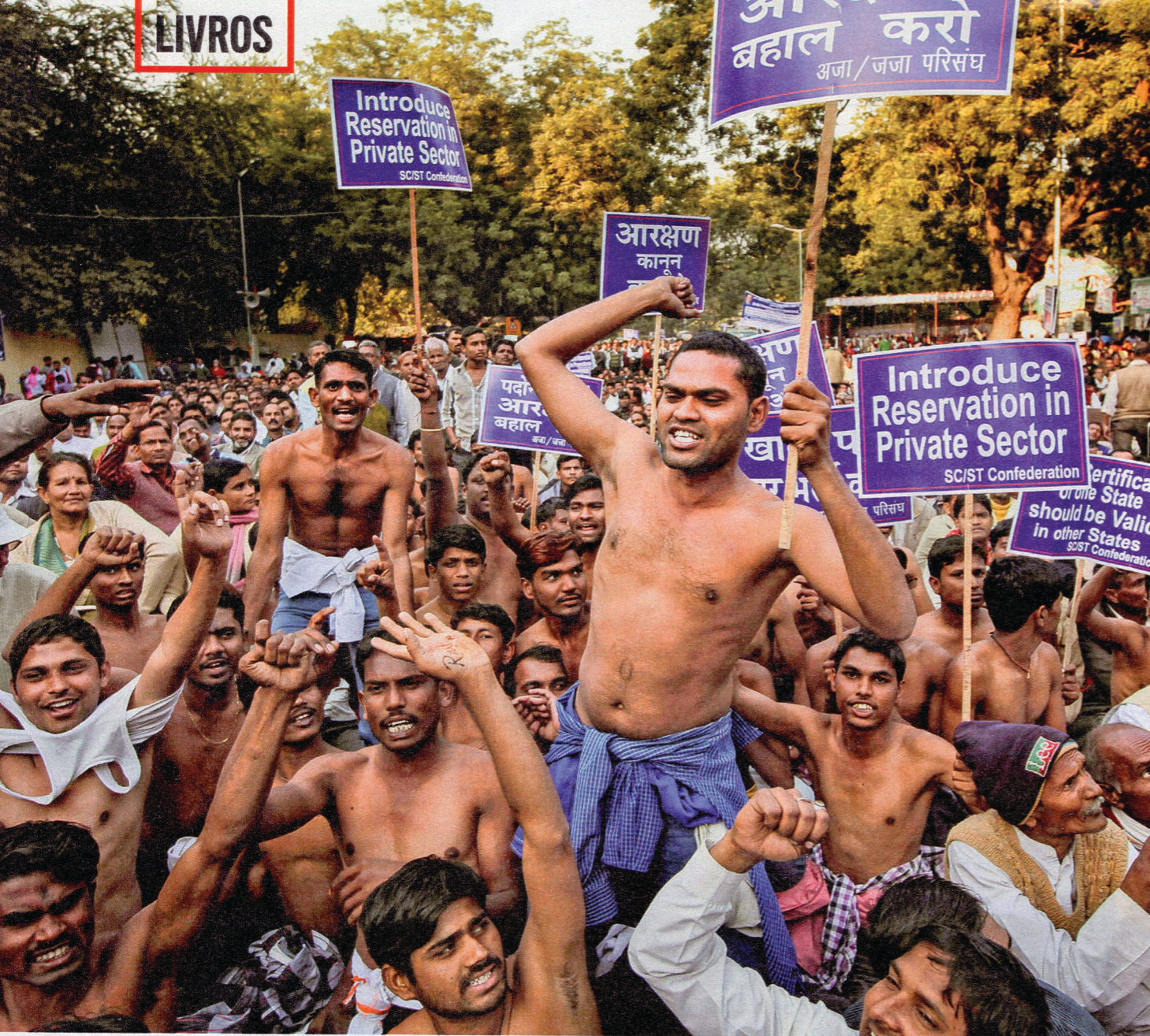
INJUSTIÇA Protesto por cotas em Nova Délhi, em 2012: as castas mais baixas da Índia nem sempre foram favorecidas